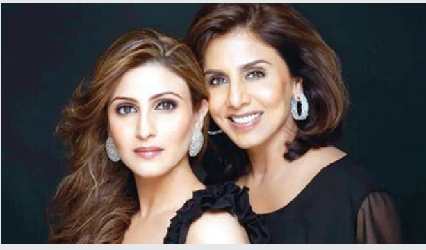
'ખુલ્લમ ખુલ્લા'માં નીતુ કપૂરે ખુલાસો કર્યો હતો કે, રિદ્ધિમા એ

હિન્દી સિનેમાના સૌથી જૂના અને પ્રતિષ્ઠિત કપૂર પરિવારમાં પૃથ્વીરાજ કપૂરના સમયથી એક કડક પરંપરા ચાલી આવતી હતી. આ પરિવારમાં ઘરના પુરુષો ફિલ્મોમાં કામ કરતા, પરંતુ મહિલાઓને તેનાથી દૂર રાખવામાં આવતી હતી. દીકરીઓને હંમેશા લગ્ન અને ઘર સંભાળવા પર ધ્યાન આપવાનું કહેવામાં આવતું. આ નિયમને વર્ષો સુધી કોઈપણ સવાલ વગર પાળવામાં આવ્યો હતો, જેના કારણે કપૂર પરિવાર એક શિસ્તબદ્ધ અને પરંપરાવાદી પરિવાર ગણાતો હતો. ઋષિ કપૂર ભલે આધુનિક વિચારધારાવાળા ગણાતા, પરંતુ પારિવારિક પરંપરાના મામલે તેઓ ખૂબ સખત હતા. તેમનું માનવું હતું કે ફિલ્મ ઈન્ડસ્ટ્રી મહિલાઓ માટે સરળ જગ્યા નથી. ઋષિ કપૂરની ઓટોબાયોગ્રાફી