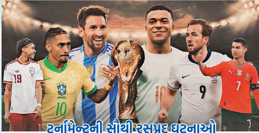
ટૂર્નામેન્ટની સૌથી રસપ્રદ ઘટનાઓ

» ૪૦ વર્ષ બાદ ઈરાકની વાપસી: ૧૯૮૬ પછી પહેલીવાર વર્લ્ડ કપમાં સ્થાન. ઈન્ટરકોન્ટિનેન્ટલ પ્લેઓફમાં બોલિવિયાને હરાવ્યું. યુદ્ધ અને રાજકીય અસ્થિરતા છતાં શાનદાર ઉપલબ્ધિ. • ઈટાલી સળંગ ત્રીજી વાર બહાર: ચાર વારની વર્લ્ડ ચેમ્પિયન ટીમ ક્વોલિફાય ન કરી શકી. બોસ્નિયા અને હર્ઝગોવિના સામે પ્લેઓફમાં હાર. વર્લ્ડ ફૂટબોલનો સૌથી મોટો ઝટકો. • ઈરાન પર વિવાદ : ફિફા અધ્યક્ષ જિયાની ઈન્ફેન્ટિનોએ સ્પષ્ટ કર્યું કે અમે ઈરાનની ટીમને પૂરો ટેકો આપીશું અને તેઓ પોતાના નક્કી કરેલા કાર્યક્રમ મુજબ રમશે. જોકે, ટીમ અમેરિકામાં રોકાશે નહીં અને પોતાની મેચ રમીને તરત જ મેક્સિકો જવા રવાના થશે.