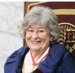
આર્ટિફિશિયલ ઇન્ટેલિજન્સ (AI)ના જોખમો, યુવા બેરોજગારી અને સૈન્ય સુધારા જેવા મુદ્દાઓ પર ભાર આપ્યો

નેતૃત્વ હવે તેમના હસ્તક છે. અંતમાં તેમણે ઉમેર્યું કે કેનેડિયનોને એક “પરિપક્વ લોકશાહી” માં રહેવાનો લહાવો મળ્યો છે, જ્યાં કાયદાનું શાસન છે અને વિવેચનાત્મક વિચારસરણી તથા નવીનતાને સન્માન મળે છે. દેશ હાલમાં અનેક સમસ્યાઓનો સામનો કરી રહ્યો છે તે સ્વીકારતા તેમણે નાગરિકોને આહવાન કર્યું કે, એક બહેતર દેશના નિર્માણમાં પોતાની વ્યક્તિગત ભૂમિકાને ક્યારેય નાની ન ગણવી જોઈએ.